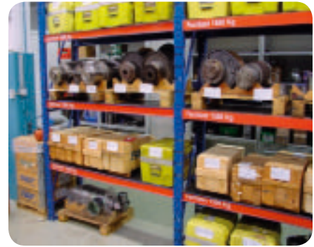
Einlagerung von Spindeln